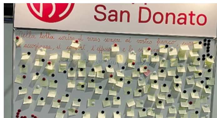
Il muro dei post-it all'hub vaccinale di Novegro e uno dei tanti messaggi

anche la qualità del servizio attraverso le faccine che ridono nell'apposito tabloid luminoso. L'entusiasmo del momento - in cui la realtà sbaraglia tutte le paure di reazioni immediate al vaccino o